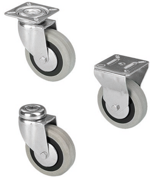
Portata - Load Capacity

-Steel swivel housing on double ball races. -Zinc plated finishing.