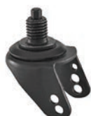
girevole codolo filettato / swivel threaded stem castor