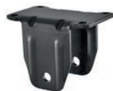
fisso piastra / fixed castor