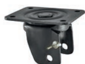
girevole piastra freno ruota / swivel castor wheel brake