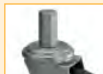
ATTACCO CILINDRICO ZINCATO ZINC FINISH STEEL STEM