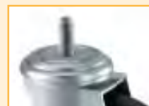
ATTACCO FILETTATO THREADED STEM