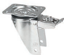
girevole piastra freno pedale anteriore regolabile / swivel castor with adjustable front brake foot lever