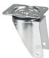
girevole piastra / swivel castor

Directional lock acting in the moving direction