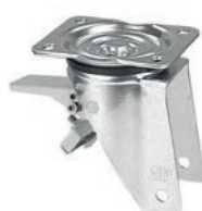
girevole piastra freno pedale posteriore / swivel castor with rear brake foot lever