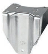
fisso piastra / fixed castor